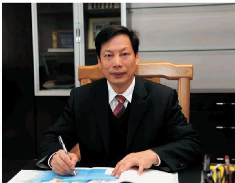
广西壮族自治区海洋局局长：

2011 年是实施“十二五”规划的开局之年，广西沿海地区深入贯彻实践科学发展观，认真落实自治区党委、政府和国家海洋局发展海洋经济的战略部署，加快推进广西区海洋经济发展方式转变和结构调整，海洋经济继续保持平稳的发展势头，实现了“十二五”时期的良好开局。根据《海洋生产总值核算制度》，广西壮族自治区海洋局对 2011 年广西海洋经济进行了初步核算，编制了《2011 年度广西海洋经济统计公报》，现予以发布。