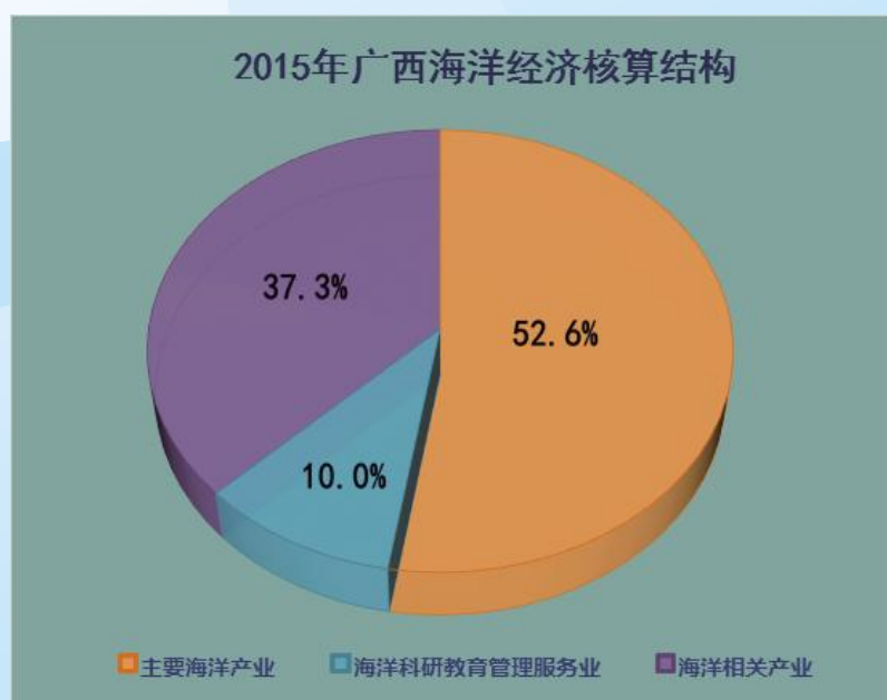
图3 2015年广西海洋经济核算结构图