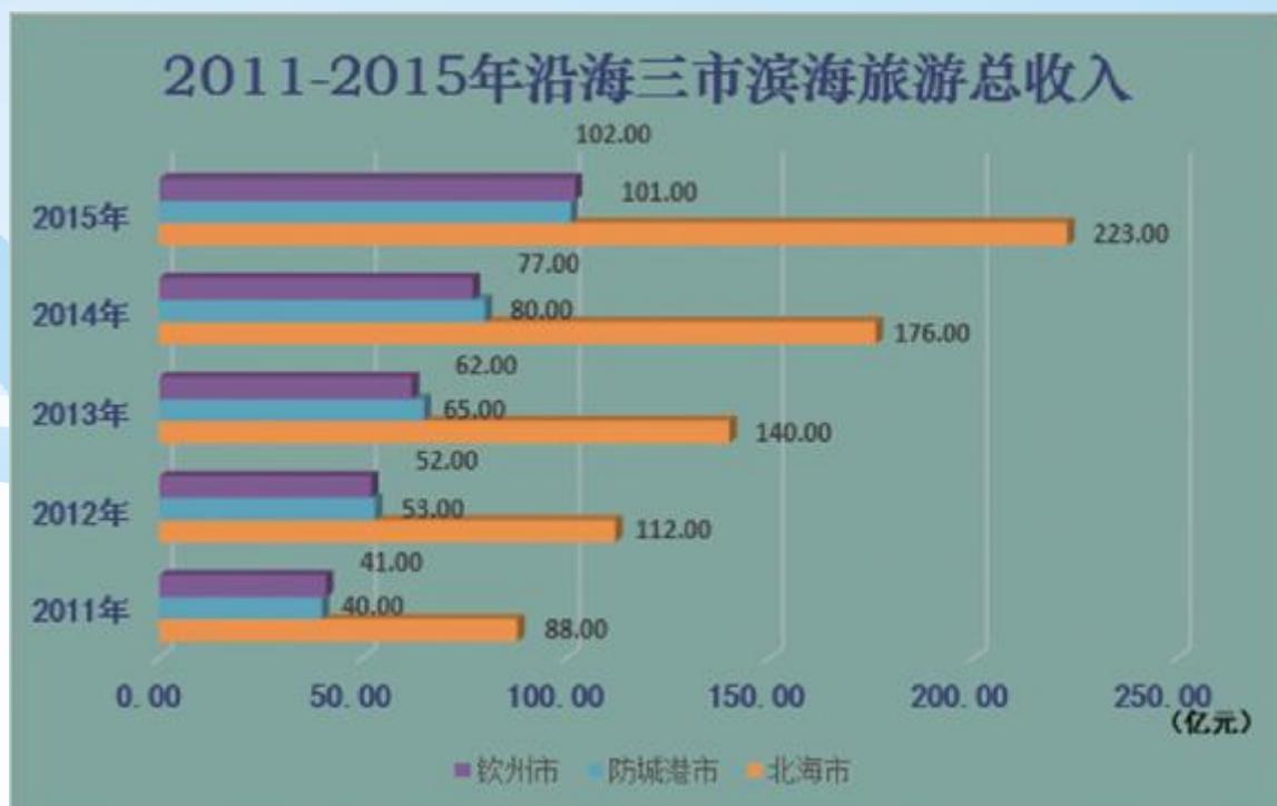
图 7 2011-2015 年年沿海三市滨海旅游总收入情况

—— 滨海旅游业 滨海旅游业继续保持较快增长。全年实现增加值 82 亿元,比去年增长 26.2%,其中,国际旅游增加值 2.20 亿元,比去年增长 10.0%。