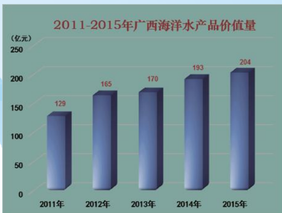
图 5 2011-2015 年广西海洋水产品价值量情况

—— 海洋渔业 海洋渔业保持平稳增长，海水养殖业发展态势良好。全年实现增加值 204 亿元，比上年增长 5.7%。其中，海洋水产品 181 亿元，比去年增长 5.2%；海洋水产品加工 9 亿元，比去年增长 12.5%；海洋渔业服务业 14 亿元，比去年增长 7.7%。