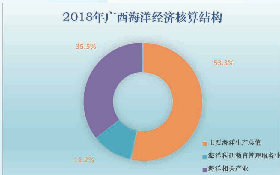
图3 2018年广西海洋经济核算结构