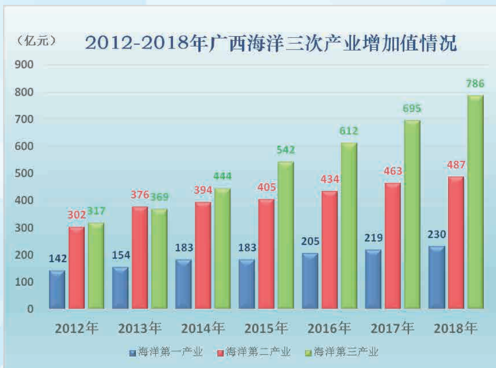
图 2 2012-2018 年广西海洋三次产业增加值情况