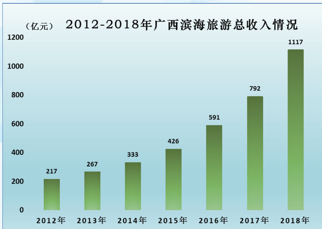
图 7 2012-2018 年广西滨海旅游总收入情况

—— 滨海旅游业 滨海旅游业继续保持较快增长。全年实现增加值 180 亿元（旅游总收入 1117 亿元），比去年增长 15.4%。