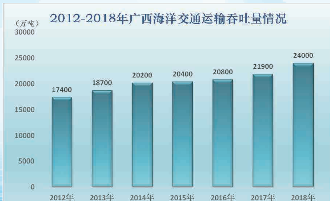
图 6 2012-2018 年广西海洋交通运输吞吐量情况

—— 海洋交通运输业 沿海港口生产总体保持平稳增长，全年实现增加值 235 亿元，比去年增长 11.4%。全年沿海港口货物吞吐量 2.40 亿吨，比去年增长 9.8%，沿海港口国际标准集装箱吞吐量 290 万标准箱，比去年增长 27.3%。